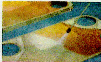
熱交換器メンテナンス