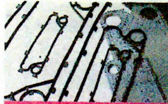
熱交換器消耗部品